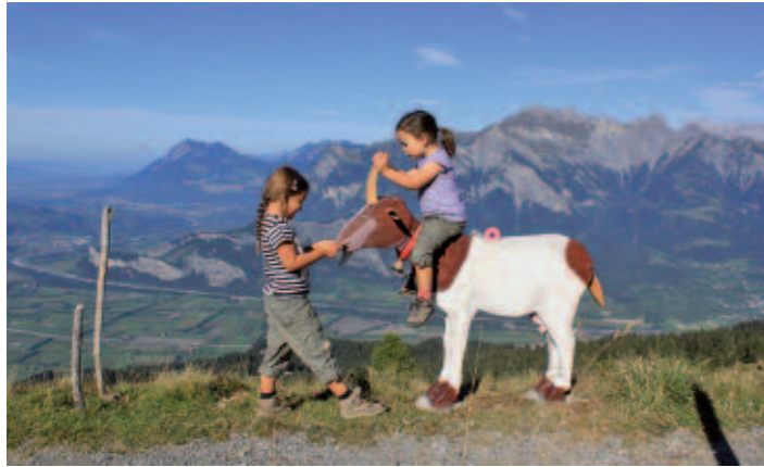
Wandern und Spaß haben über den Alpengipfeln.

Wer ein einfach erreichbares Busziel in der Schweiz sucht, der ist bei den Pizolbahnen genau richtig. Die beiden Talstationen in Bad Ragaz und Wangs liegen auf 500 m ü.M. und sind nur fünf Minuten von der Autobahnausfahrt entfernt. Steile Bergstraßen entfallen, was die Anfahrt äußerst materialschonend macht. Mit Gondel- und Sesselbahn geht es bequem bis auf 2.222 Meter hoch. Die Panoramansicht vom Pizol über die Ostschweizer und Vorarl-