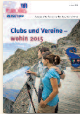
Clubs und Vereine – wohin 2015 Januar 2015