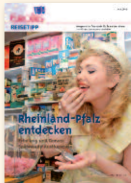
Rheinland-Pfalz entdecken Juli 2015