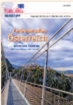
Ferienparadies Österreich April 2015