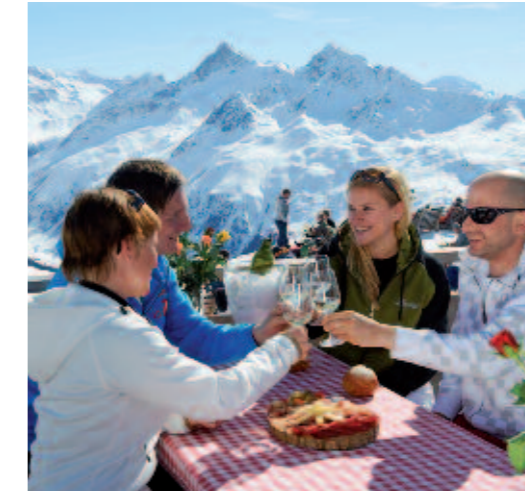
Ob beim Apres-Ski auf dem Jakobshorn oder auf der Sonnenterrasse im Walserhuus Sertig – Davos Klosters ist Sommer wie Winter ein attraktives Reiseziel.

Klosters wurde als Winter- und Sommerferienort schon vor über 100 Jahren bekannt. Ein entscheidender Impuls für seine Entwicklung zum stilvollen Ferienklassiker für Connaisseurs ereignete sich in