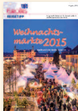
Weihnachtsmärkte II August 2015