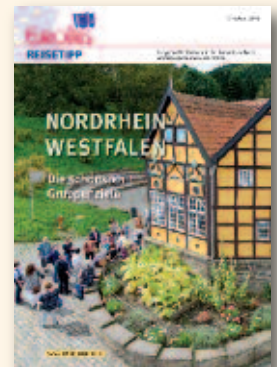
NRW Oktober 2015