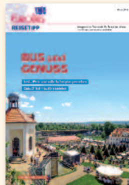
Bus und Genuss Mai 2015