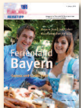
Ferienland Bayern Februar 2016