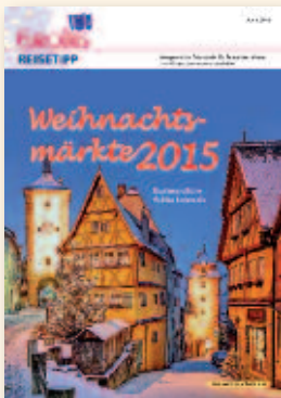
Weihnachtsmärkte Juni 2015