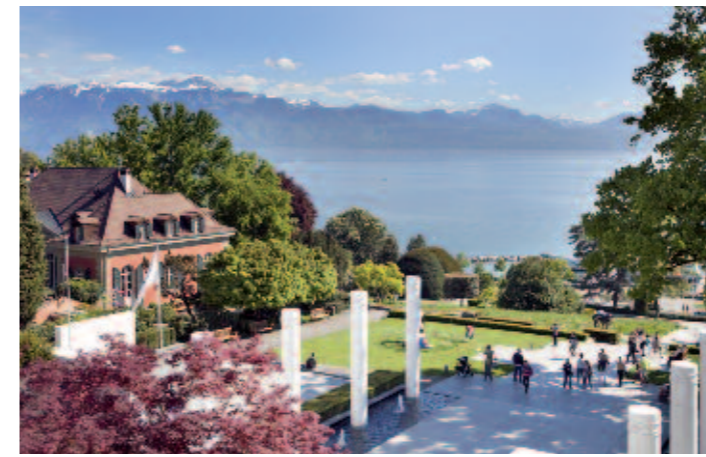
Die große olympische Treppe verbindet den Quai d'Ouchy mit dem Museumsvorplatz.