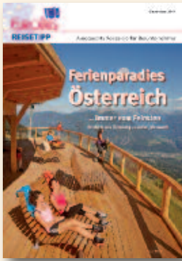
Ferienparadies Österreich Dezember 2014