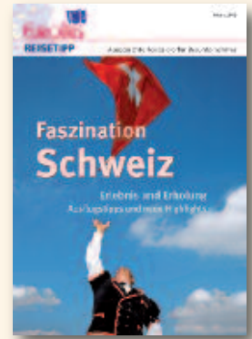
Faszination Schweiz März 2015