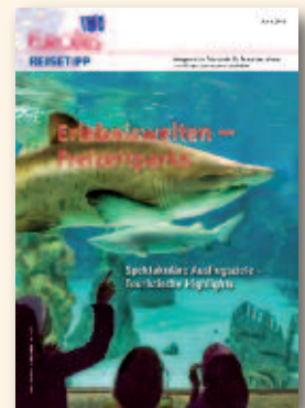
Erlebniselten ... Juni 2015