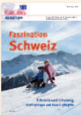
Faszination Schweiz November 2015