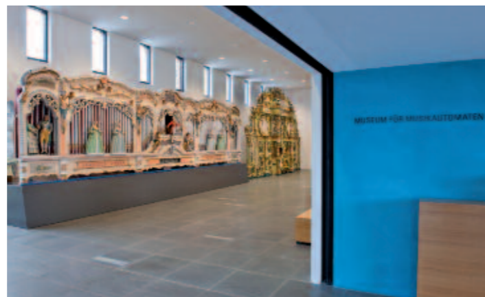
Schon im Foyer befinden sich spektakuläre Exponate.

Das Museum für Musikautomaten Seewen SO begeistert seit Jahren eine wachsende Fangemeinde. Rund 20 km südlich von Basel gelegen, gehört es zu den beliebtesten Attraktionen der Nordwestschweiz. Es beherbergt eine der weltweit größten und bekanntesten Sammlungen von Schweizer Musikdosen, Plattenspieldosen, Uhren und Schmuck mit Musikwerk sowie anderen mechanischen Musikautomaten aus dem 18. Jahrhundert bis in