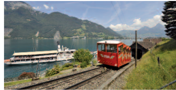
Eine Reise nach Seelisberg und eine anschließende Schiff- und Bergbahnfahrt ist eine beliebte Ausflugsfahrt im Herzen der Schweiz.

Die Gotthard-Autobahn A2 führt durch eine der schönsten Landschaften der Schweiz. Auf der Fahrt entlang vom Vierwaldstättersee verwandelt sich die sanfte Hügellandschaft in die imposante Bergwelt der Schweizer Alpen. Auf einer Halbinsel im Vierwaldstättersee liegt das Aussichtsplattform Seelisberg. Das Bergdörfchen liegt direkt über der Rütliwiese und den weiteren Schauplätzen aus Schillers „Tells-Geschichte“. Der „Schilferbalkon“ in Seelisberg ist einer