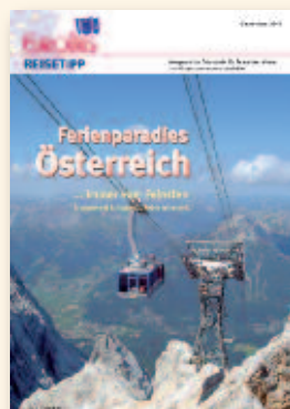
Ferienparadies Österreich Dezember 2015