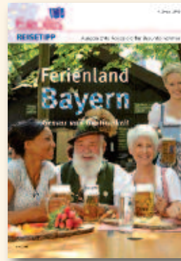
Ferienland Bayern Februar 2015