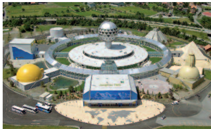
Der JungfrauPark aus der Vogelperspektive.

Der einzigartige Freizeitpark im Berner Oberland bietet eine einmalige Möglichkeit in eine andere Welt abzutauchen und den Rätseln dieser Welt auf die Spur zu kommen. Fünf Themenpavillons entführen in die rätselhaften und fantastischen Welten des Schweizer Autors Erich von Däniken.